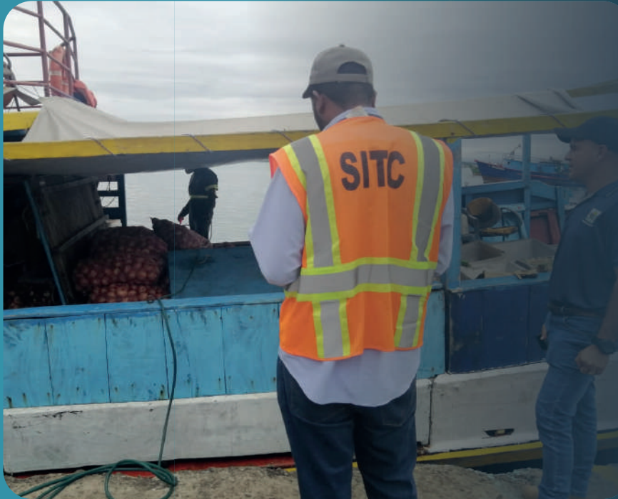
Autoridades panameñas durante el operativo del decomiso de la cebolla.