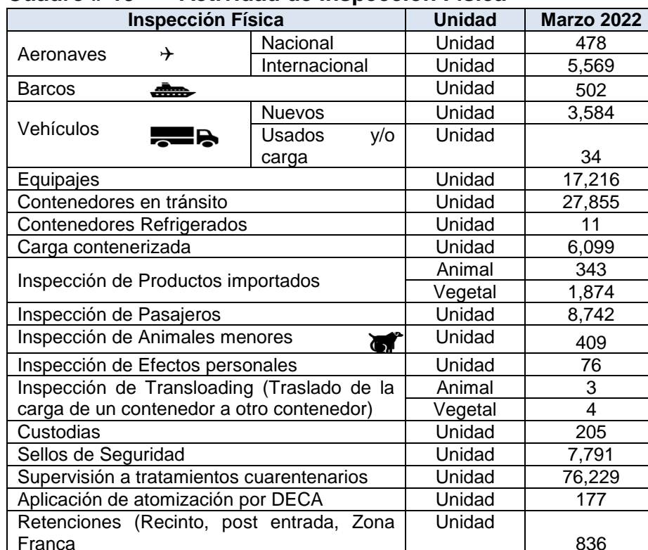
Cuadro # 19 Actividad de Inspección Física